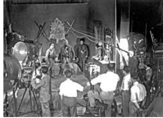
Solda: İpek Film Stüdyosunda bir dublaj çalışması Sağda: Bir Millet Uyanıyor'un çekimlerinden bir kare

İş Bankası'na ödemek zorunda oldukları 80-90 bin liralık borç nedeniyle 1937'de İpekçiler maddi krize girer ve sektörde gerilemeye başlarlar. Ancak İş Bankası iştiraklerinden Türk Tecim Anonim Sosyete, FİTAŞ'a ortak olunca finansal açıdan rahatlarlar. 1938'de bilet fiyatları üzerindeki vergilerin %33'ten %10'a inmesiyle rahat bir nefes alıp tekrar film yapmaya başlarlar. Ancak 1942'deki Varlık Vergisi bellerini bükür. Artık 1930'lardaki parlak günler geride kalmıştır. İlk kuşak ölünce şirketler kalabalık varislere dağılır ve zamanla el değiştirir. 1976'da Yeni Melek ve Yeni Sinema'nın Has Ailesi 'ne geçmesiyle aile sinema dünyasından silinir.