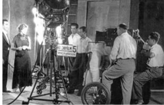
Solda: İpek Film Stüdyosu