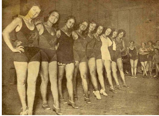
Karım Beni Aldatırsa 'daki bale ekibinin stüdyodaki provasından

Sonuç olarak İpekçi Kardeşler 'in ilkin Selanik Bonmarşesi'nde kamera ve ham film satışı yaparak temas ettikleri sinema serüveni, önce sinema işletmeciliği ve film dağıtımını ile başlar. Sonrasında ise aile film yapımına başlar. Yenilikleri takip etmeleri ve girişimcilikleriyle özellikle 1930'lar boyunca sinema sektöründe artan bir etkiye sahip olur. Büyük sermayenin bu alana yeterli ilgiyi göstermemesi de önlerini açar. Ancak İpekçiler , bir aile şirketi olmanın ötesine geçip kurumsallaşma yoluna gitmedikleri için dağılırlar. İlk jenerasyonun ölümü sonrasında diğer aile bireyleri bu alandaki girişimleri sürdürmede yetersiz kalır. Kuşkusuz özellikle Varlık Vergisi de aileye büyük darbe indirmiştir. Her şeye rağmen, İpekçiler , Türkiye'de sinemanın gelişip şekillenmesinde imzasını atacak kadar güçlü ve etkili olmuştur.